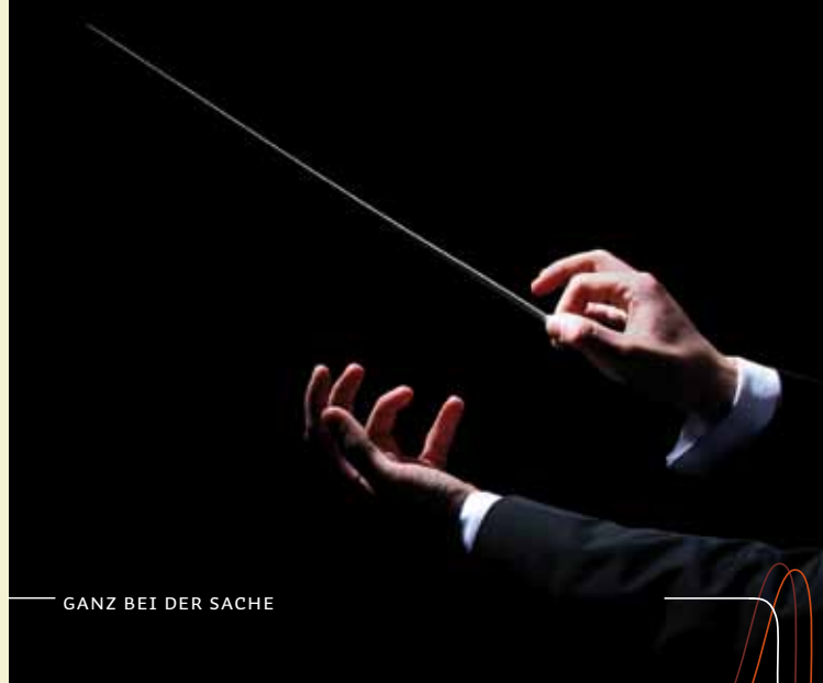
GANZ BEI DER SACHE

Die Trainingsmusik ist angenehm zu hören und einfach zu handhaben. Die meisten Betroffenen empfinden die täglichen Minuten mit der BENAUDIRA - Musik als schöne und wohltuende Bereicherung ihres Tagesablaufes.